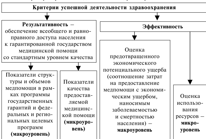
Схема 2. Критерии успешной деятельности здравоохранения

В настоящее время сохраняется низкая эффективность использования имеющегося очень важного ресурсного потенциала – первичного амбулаторно-поликлинического звена.