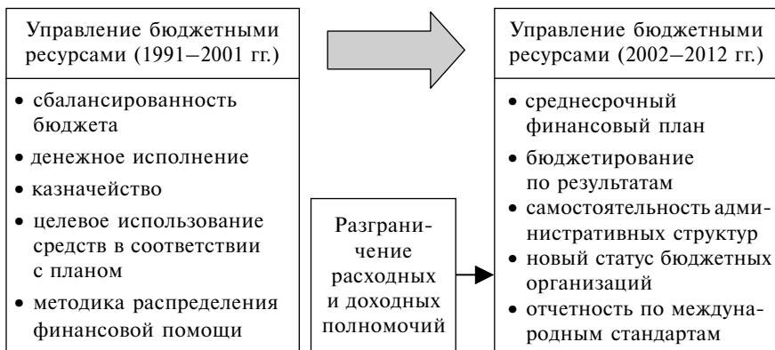
Схема 1. Подходы к развитию управления общественными финансами

ветствующих хозяйственных субъектов, перечень производимых в отрасли товаров и услуг и сопровождающие эти процессы финансовые потоки.